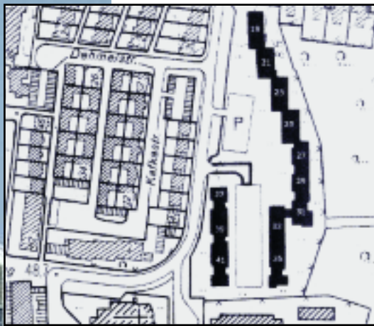
2. Gebäude Schumacherring