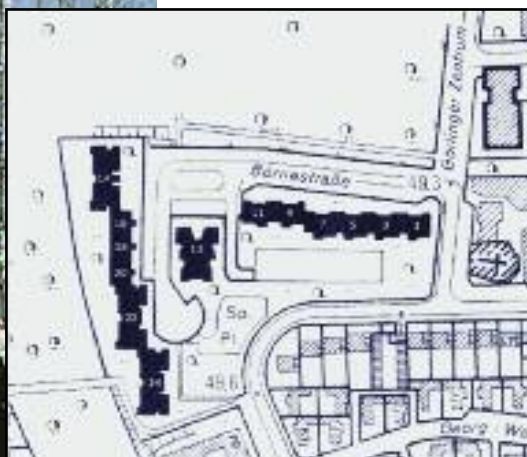
3. Gebäude Börnestrasse